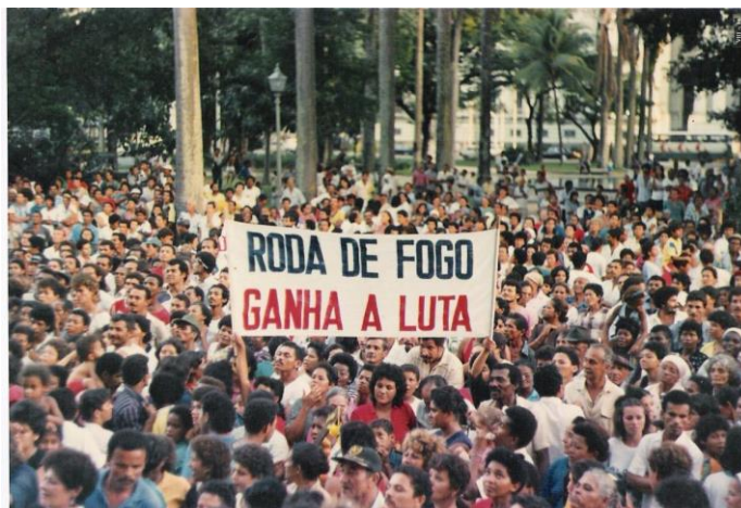
Figura 2 – Protesto da comunidade de Roda de Fogo em frente ao Palácio do Governo do Estado de Pernambuco.

Sem baldas de dúvidas a ação positiva de ocupação de Roda de Fogo se atribui ao engajamento político dos diversos sujeitos presentes no início da ocupação, bem como a publicitação pelo direito humano à moradia de forma organizada e reivindicatória através da Comissão de Justiça e Paz e população, e posteriormente reconhecida pelo governo do Estado.