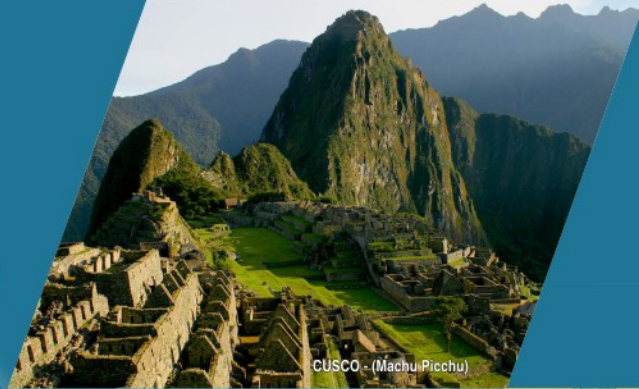
CUSCO - (Machu Picchu)