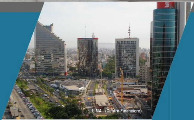
LIMA - (Centro Financiero)