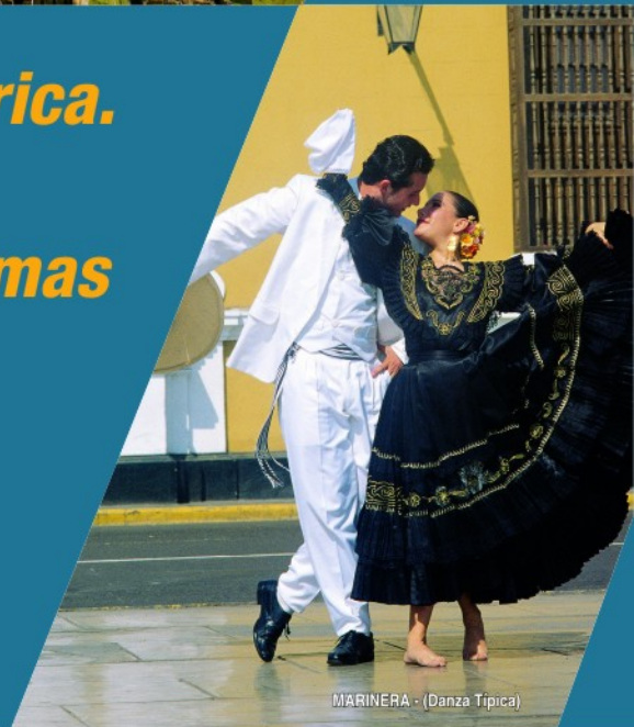
MARINERA - (Danza Típica)

El Arbitraje en Latinoamérica. ¿Crisis de crecimiento? Nuevos y antiguos problemas